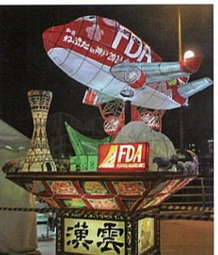
神戸をモチーフにしたねぶた