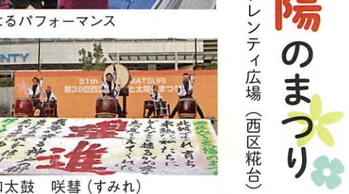
伊川谷北高等学校書道部によるパフォーマンス

伊川谷北高等学校書道部によるパフォーマンス... 書道部の作品を前方に飾ったステージで、よさこいや和太鼓、ダンス、民謡など24団体が出演し日頃の練習の成果を披露し盛り上げた。