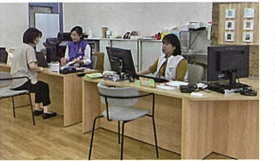
地域活動カウンター